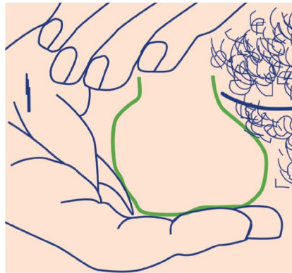
Abb. 1 Anleitung zur Selbstuntersuchung.