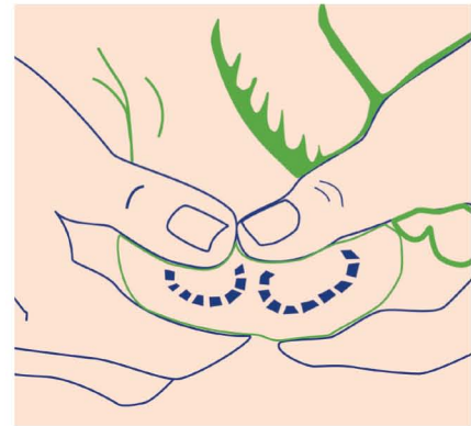
Abb. 2 Anleitung zur Selbstuntersuchung.